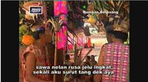
Gambar B - Beramban

Nama tuju orang mantaika leka main beramban