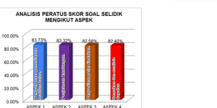
ANALISIS PERATUS SKOR SOAL SELIDIK MENGIKUT ASPEK