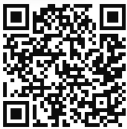
Nota Ringkas Zaman Prasejarah

HTTPS://PADLET.COM/IZZAHATIRAHASMAI/ZLIDAFVP2T3HC9X