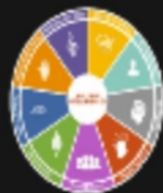
HOWARD GARDNER'S Multiple Intelligences