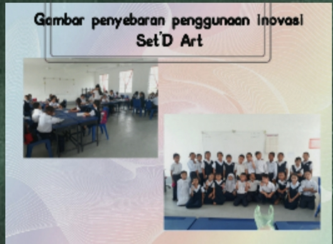
Gambar penyebaran penggunaan Inovasi Set'D Art