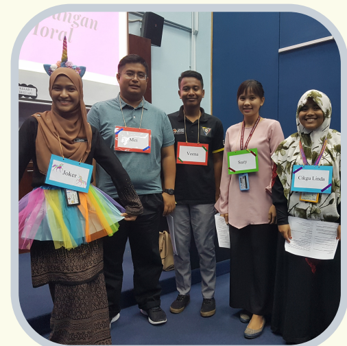
4. Lakonan Intervensi