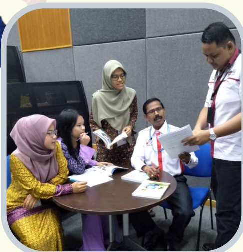
1. Olahan Skrip